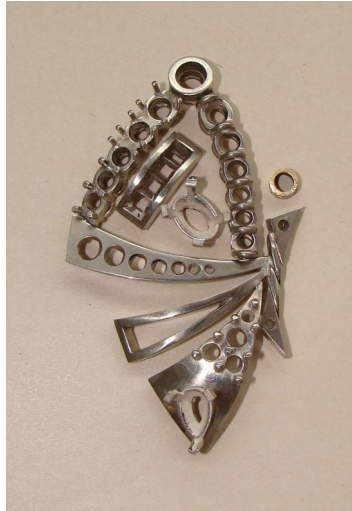
Echelle : 1